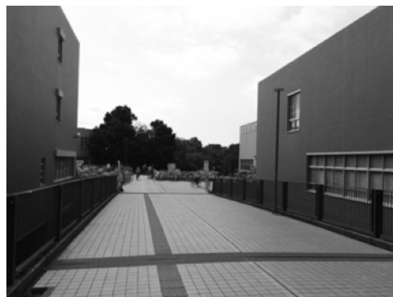
(2) 人通りが少ない状況