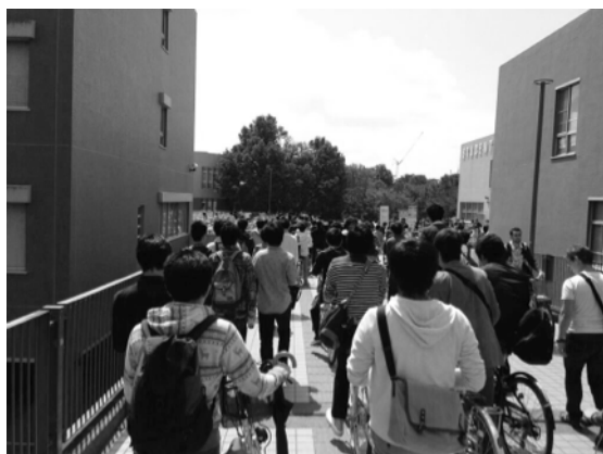
(1) 道路の全体的に人が多い状況