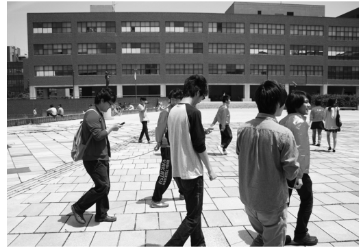
Seeing Eye People