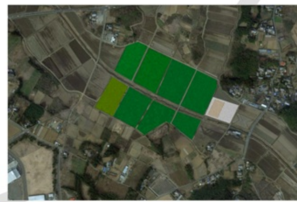
新治地区整備予想図