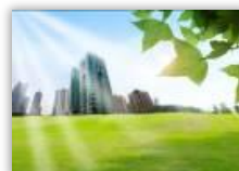
スマートエネルギー