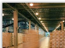
製造/物流/流通/サービス