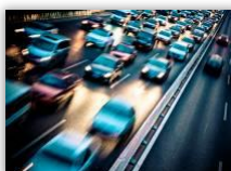
交通・都市インフラ