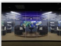
サイバーセキュリティソリューション